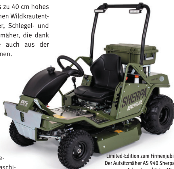
Limited-Edition zum Firmenjubiläum: Der Aufsitzmäher AS 940 Sherpa 4WD Adventure.

nen oder Gartenhacksler sind aus dem Portfolio verschwunden. „Wir hatten zu viele verschiedene Produktsegmente im Programm und setzen heute den Fokus auf unsere Kernprodukte, mit denen wir groß geworden sind“, sagt der Firmenchef, der, wie auch seine Schwester, in seiner Jugend schon im Betrieb mitgeholfen hat. „Wir unterliegen konjunkturellen und, als Produkthanbieter für die